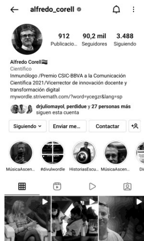
Figura 1. Perfil de Alfredo Corell

Alfredo Corell (ver Figura 1) es inmunólogo y catedrático en Inmunología en la Universidad de Valladolid, donde además es vicerrector de Innovación docente y transformación digital y se unió a Instagram en abril de 2012.