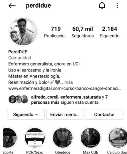
Figura 5. Bio y algunos destacados del perfil de @perdidue

En cuanto a los recursos visuales, Perdiguera utiliza vídeos de terceros para hacer sus propios montajes —generalmente con imágenes de medios de comunicación— o para difundirlos tal cual y en ellos destaca el uso del texto dentro del propio vídeo para explicar algún aspecto del mismo. Y esta práctica de utilizar materiales de otros también la utiliza en las publicaciones de imágenes fijas, a las que igualmente acompaña de texto, pero sin ninguna identidad visual. Cuando realiza algún vídeo propio, utiliza el plano selfie , hablando directamente a cámara, como lo hace en las stories , las cuales son muy numerosas y buena parte de ellas aparecen agrupadas en temáticas en los destacados del perfil (ver Figura 5).