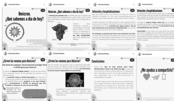
Figura 4. Diapositivas que componen una publicación en Carrusel de Laura Taina

tema de manera textual, acompañado de una ilustración (66,7%), su logotipo (100% de las publicaciones), bibliografía (66,7%) y una frase de Marie Curie en inglés (100%). El resto de las diapositivas son textos con algunos dibujos ilustrativos y una última diapositiva en la que pide ayuda para compartir la publicación (ver Figura 4).