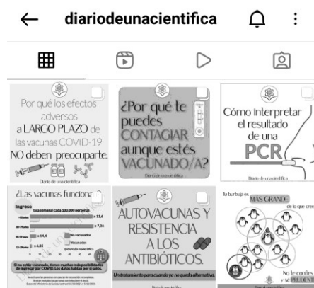
Figura 1. Publicaciones de @diariodeunacientifica

A pesar de haber tenido que abrir otro perfil, a 20 de marzo de 2022, @diariodeunacientifica contaba con una comunidad de más de 42.000 seguidores, había publicado 55 post y numerosas stories , uno de los formatos más usados por la divulgadora en Instagram. Durante el periodo analizado, Almagro había realizado 22 publicaciones, de las que el 59,1% fueron carrusel de imágenes de texto e ilustración, el 27,3% fueron reels de vídeo, el 9,1% post de una única imagen y el 4,5% fue de post de vídeo. En este sentido, hay que destacar que Lucía Almagro ha desarrollado una identidad visual para todas sus publicaciones —especialmente en las imágenes fijas, aunque también en muchos de sus vídeos—, que aporta unidad y coherencia al perfil (ver Figura 2).